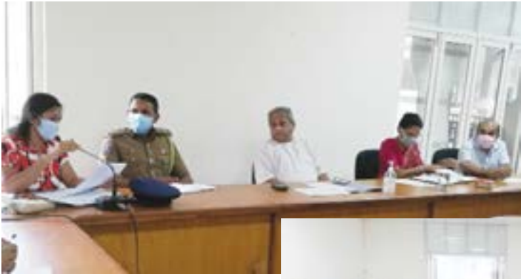
காவல்துறை தினகரன் விசேட நிருபர்

இரத்தினபுரி மாவட்டத்தில் தனிமைப்படுத்தி வைக்கப்பட்ட 514 பேரின் அவதானிப்பு நிறைவுடைந்துள்ளதாக இரத்தினபுரி மாவட்ட ஒருங்கிணைப்புக்குழு கூட்டத்தில் தெரிவிக்கப்பட்டது. இரத்தினபுரி மாவட்ட கொரோனா ஒழிப்பு ஒருங்கிணைப்புக்குழு கூட்டம் நேற்று முன்தினம் (28) சப்ரகமுவ மாகாண ஆளுநர் தலைமையில் இரத்தினபுரி மாவட்ட செயலகத்தில் இடம்பெற்றபோது இவ்வாறு தெரிவிக்கப்பட்டது. கோவிட் 19 தொற்றுநோய் அடையாளம் காணப்பட்ட பின்னர் இரத்தினபுரி மாவட்டத்தில் வெளிநாடுகளில் இருந்து வருகை தந்த 845 பேர் தனிமைப்படுத்தி வைக்கப்பட்டனர். அதில் 514 பேரின் தனிமைப்படுத்தப்பட்ட அவதானிப்பு நிறைவுடைந்து, மேலும் 331 பேர் தனிமைப்படுத்தி வைக்கப்பட்டுள்ளனர். இவர்களில் பல்வேறு பகுதிகளிலிருந்து வருகை தந்தவர்களில் கோவிட் 19 உறுதி