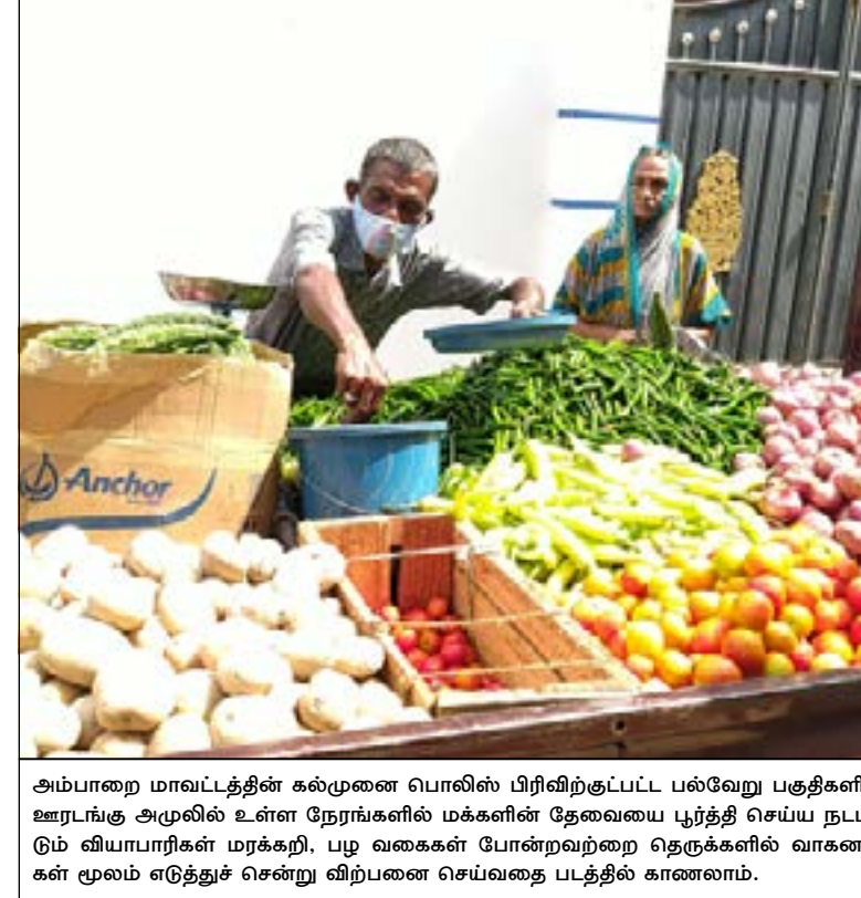
அம்பாறை மாவட்டத்தின் கல்முனை பொலிஸ் பிரிவிற்குட்பட்ட பல்வேறு பகுதிகளில் ஊரடங்கு அமுலில் உள்ள நேரங்களில் மக்களின் தேவையை பூர்த்தி செய்ய நடமாடும் வியாபாரிகள் மரக்கறி, பழ வகைகள் போன்றவற்றை முருக்களில் வாங்கும் மூலம் எடுத்துச் சென்று விற்பனை செய்வதை படத்தில் காணலாம்.