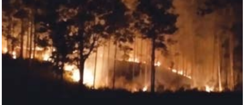
தலவாக்கலை குறுப் நிருபர்

தலவாக்கலை கிளையோரா தோட்ட வளப்பகுதிக்கு தீ வைத்த இருவர் தலவாக்கலை பொலிஸாரினால் கைது செய்யப்பட்டுள்ளதாக தலவாக்கலை பொலிஸார் தெரிவித்தனர். கைது செய்யப்பட்ட இருவரும் கடந்த வெள்ளிக்கிழமை இரவு தலவாக்கலை கிளையோரா தோட்ட வளப்பகுதிக்கு தீ வைத்துள்ளனர். இந்த தீ பரவல் காரணமாக வளப்ப