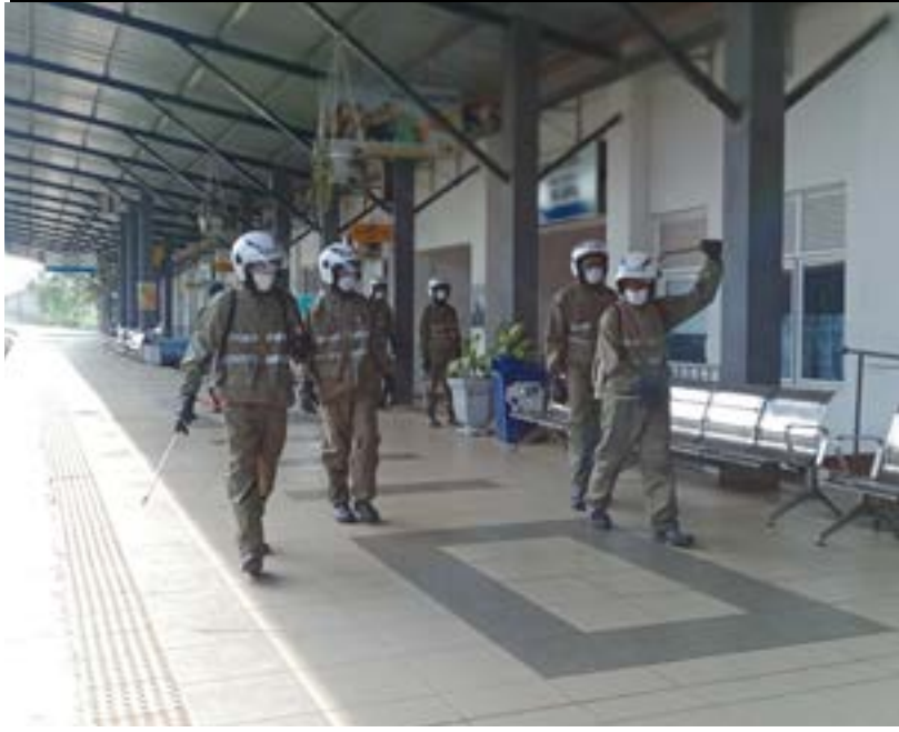
யாழ்ப்பாணம் பிரதான புகையிரத நிலையத்தில் கிருமி தொற்று விசிறும் நடவடிக்கையின் போது.