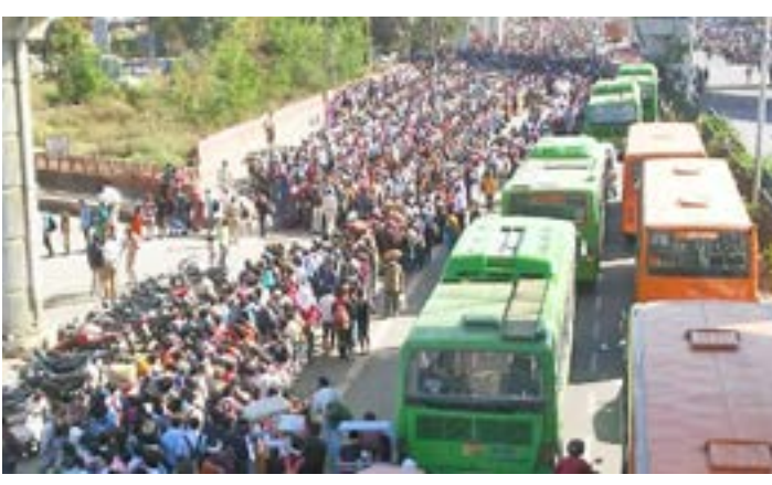
கூறப்படுகிறது. மேற்கண்ட மாநிலங்களிலிருந்து இந்த மக்களின் பிரச்சினைகளை தீர்க்க முடியாத சூழல் நிலவுகிறது.

ஆகியவை முடக்கியுள்ளதால் இடம்பெயர்ந்த தொழிலாளர்களால் தங்கள் குடும்பத்தினருக்கு உணவளிக்க முடியாமல் தவித்து வருகிறார்கள். அது போல் பணமில்லாமல் தங்கியிருக்கும் அறைகளுக்கு வாடகை கொடுக்கவும் முடியவில்லை. இன்று அமுலில் உள்ள ஊரடங்கு உத்தரவே சமூகப் பரவலைத் தடுக்கத்தான். ஆனால் டெல்லியிலிருந்து இது போன்று ஆயிரக்கணக்கானோர் தங்கள் சொந்த மாநிலங்களுக்கு போக்குவரத்து வசதியின்றி நடந்தே செல்கிறார்கள். கூட்டம் கூட்டமாக அவர்கள் செல்வதால் கொரோனா பரவும் அச்சம் அதிகமாக உள்ளது. இவர்கள் மிகவும் தொலைதூர கிராமங்களுக்குச் செல்வதால் கொரோனாவையும் இவர்கள் கொண்டு செல்வார்களான என்ற அச்சம் எழுகிறது. பொதுவாக ஊடகங்களில் காணப்படுபவர்கள் டெல்லி மட்டுமே. ஆனால் மற்ற மாநிலங்களில் இருந்து இது போல் மக்கள் புலம்பெயரத் தொடங்கியிருக்கலாம் எனக்