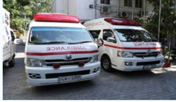
கும் சுகாதார அமைச்சர் பவித்ரா வன்னியராச்சி தனது நன்றிகளை தெரிவித்துக்கொண்டார். மேற்படி நிகழ்வில் ஹைவாய்