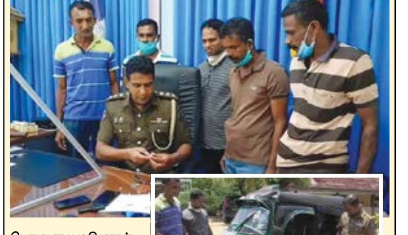
மொனறாகலை தினகரன் நிருபர்

மொனறாகலை பொலிஸ் பிரிவுக்கு உட்பட்ட பன்சல்வத்த பகுதியிலிருந்து மொனறாகலை நகரத்திற்கு முச்சக்கர வண்டியின் ஊடாக 12 கிராம் ஹேரோயின் போதை பொருள் கடத்திய சந்தேகத்தி பேரில் நால்வர் மொனறாகலை பொலிஸாரால் நேற்று கைது செய்யப்பட்டுள்ளதுடன் முச்சக்கர வண்டியும் பறிமுதல் செய்யப்பட்டுள்ளது. இவ்வாறு கைது செய்யப்பட்டவர்கள் மொனறாகலை பன்சல்வத்த பகுதியை பிறப்பிடமாக கொண்ட 20 மற்றும் 30 வயதை கொண்டவர்களாவர் என தெரி