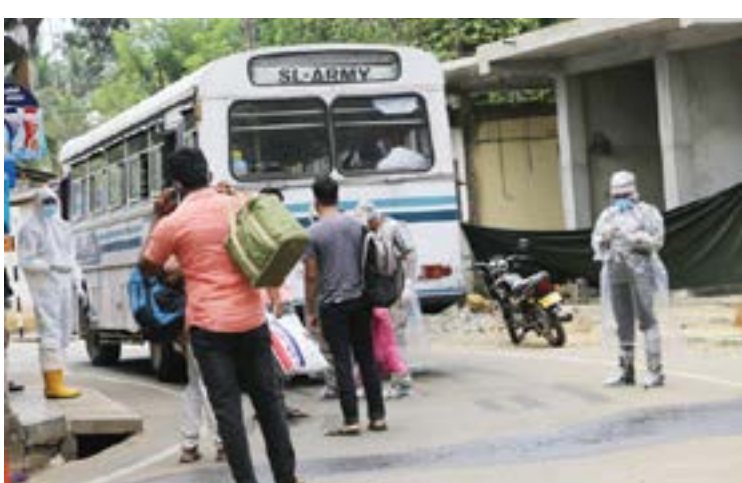
பண்டாரகம, அட்டுலுகம் கிராமத்தில் கொரோனா தொற்றுள்ள ஒருவர் கண்டுபிடிக்கப்பட்டதையடுத்து கிராமம் முழுமையாக மூடப்பட்டதுடன் தொற்றுள்ள நபர் நெருங்கிய பழுவிய கிராமத்திலுள்ள அனைவரும் தனிமைப்படுத்தலுக்காக பாதுகாப்பாக அழைத்துச் செல்லப்பட்ட போது...