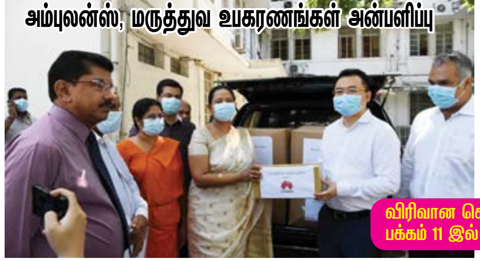
அம்பலன்ஸ், மருத்துவ உபகரணங்கள் அன்பளிப்பு